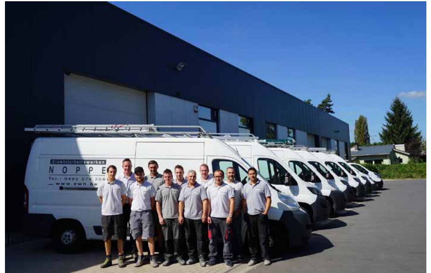
Het team van Elektriciteitswerken Noppe.

bijkomende opleidingen, om alle functionaliteiten van het programma goed onder de knie te krijgen. "Het is dan ook een bijzonder uitgebreid pakket. Om er goed mee weg te zijn, is voldoende deskundige uitleg onmisbaar."