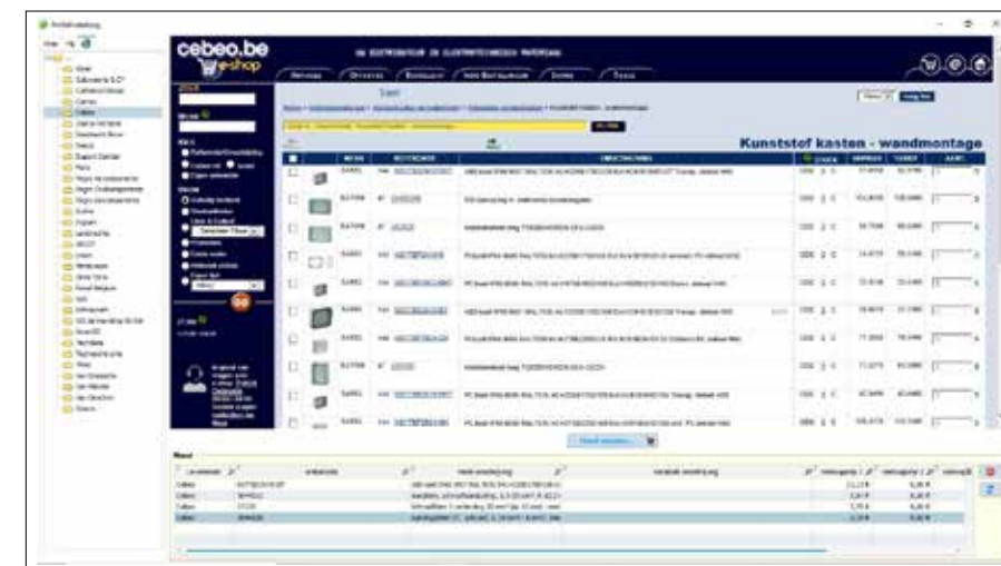
Vanuit Plenion krijgen we geactualiseerde prijsoverzichten van de leveranciers en kunnen we rechtstreeks bij hen bestellen.

Intussen gebruikt Elektriciteitswerken Noppe Plenion over de gehele levensloop van een project - van de prospectie over het maken tot de offerte tot de werffase en de nabalculatie. "Een goedgekeurde offerte wordt in Plenion omgezet in een project. Nadien bestellen we via Plenion de benodigde materialen, gaat de werkbom mee naar de technici, die een goed zicht hebben op wat er moet gebeuren. Na afronding van de werkzaamheden krijgt de klant via Plenion een gedetailleerde factuur in de bus. Zonder Plenion zou onze dagelijkse werking helemaal in duigen vallen", aldus Noppe. ■