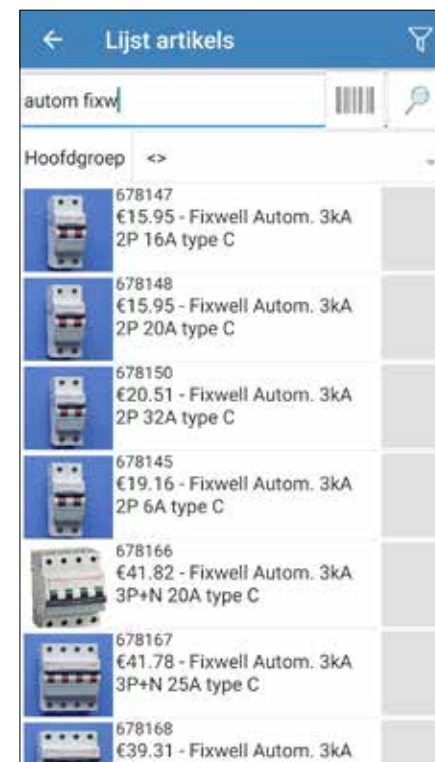
Anders dan bij het vorige ERP-pakket biedt Plenion de mogelijkheid om verbinding te maken met de leveranciers.