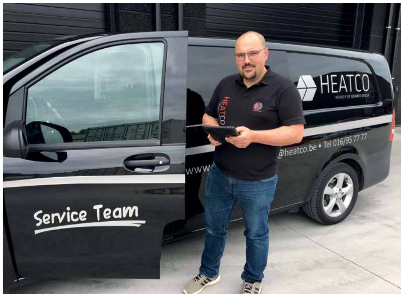
De installateurs kunnen mobiel werken via de app sinds de introductie van de ERP-software van Plenion.

Tekst Liesbeth Verhulst